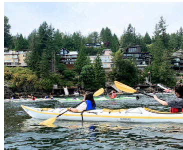
SPRING/ SUMMER ACTIVITY DAY