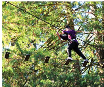
FALL ACTIVITY DAY