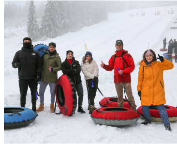
WINTER ACTIVITY DAY